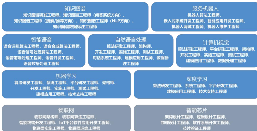
图 2 人工智能行业细分领域重点岗位分析

人工智能产业的稳步发展一方面加速了技术革新的进程，同时在产业人才需求上也催生出众多的人工智能相关岗位。基于人工智能产业技术架构以及人工智能企业的实际用人需求，针对技术架构中基础层和技术层涵盖的人工智能岗位进行归纳梳理，在本标准中涉及到以下细分领域的重点岗位，具体如图 2 所示。